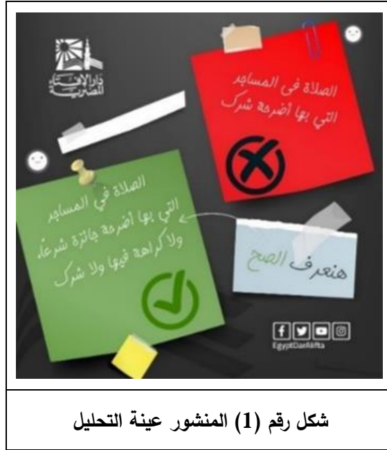
شكل رقم (1) المنشور عينة التحليل

الحملة الدينية الرسمية لدار الإفتاء المصرية الموسومة ب (اعرف الصح)، وهي حملة أطلقتها دار الإفتاء المصرية على مواقع التواصل 1 أكتوبر في 2021م؛ وجاء ضمن تعريف الحملة على الموقع الرسمي لدار الإفتاء المصرية بفيسبوك بأنها، تهدف إلى (تصحيح مفاهيم - الرد على فتاوى شاذة - توضيح لمعتقدات خاطئة - تنفيذ شبهات متطرفة) بحيث شملت 6 منصات، تحت وسم/هاشتاج (اعرف الصح- هنعرف الصح- ده الصح) تشمل الحملة موضوعات (الأخلاق-العبادات- المعاملات- الأسرة - تصحيح فتاوى التطرف والتشدد والإرهاب)