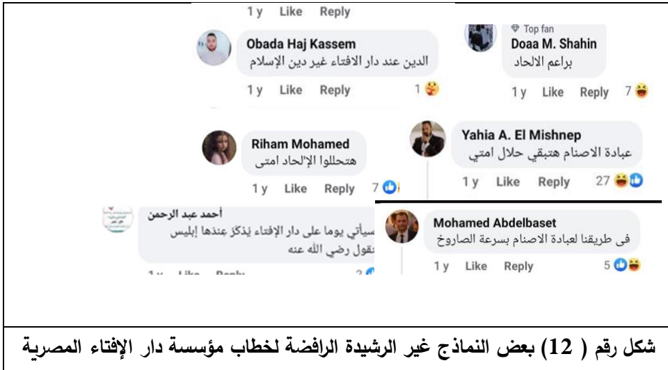
شكل رقم (12) بعض النماذج غير الرشيدة الراضية لخطاب مؤسسة دار الإفتاء المصرية

فيما شملت بعض التعليقات غير الرشيدة المعارضة للدار على بعض الاتهامات الخطيرة - غير المقبولة على الإطلاق- والتي تنطوي على معنى المروق من الدين، ما يدل على الانخفاض الشديد والخطير في مستوى الوعي وعدم تقدير خطورة الكلمة؛ كما هو موضح بالشكل التالي: