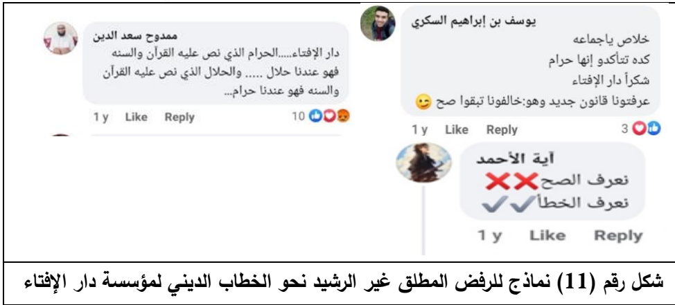
شكل رقم (11) نماذج للرفض المطلق غير الرشيد نحو الخطاب الديني لمؤسسة دار الإفتاء

فيما شملت بعض التعليقات غير الرشيدة المعارضة للدار على بعض الاتهامات الخطيرة - غير المقبولة على الإطلاق- والتي تنطوي على معنى المروق من الدين، ما يدل على الانخفاض الشديد والخطير في مستوى الوعي وعدم تقدير خطورة الكلمة؛ كما هو موضح بالشكل التالي: