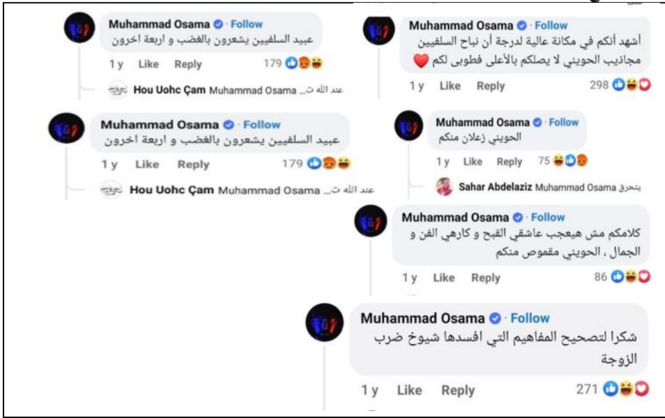
شكل رقم (10) نموذج للرفض المطلق غير الرشيد نحو الخطاب السلفي ورموزه

فيما ارتكز تعليق بعض المعارضين لفتاوى الدار كذلك على الموقف المسبق، و الرفض المطلق، بما يدل كذلك على انخفاض مستوى البلاغة لدى أصحابها كما هو موضح بالشكل التالي: