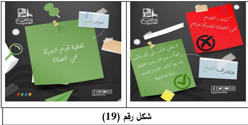
شكل رقم (19)

تلك الاستجابات الراشدة، والتي تعتقد الباحثة أنها ربما انعكست فعليا على تعديل مسار الحملة -عينة التحليل- في بعض الأمور منها: تعديل التصميم الأول للحملة، في تناول نفس الموضوع وهو ما يظهر في الشكل التالي: