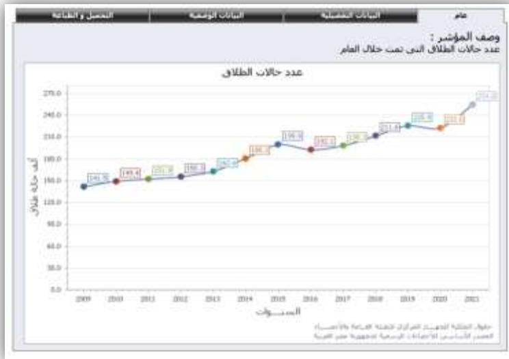
شكل رقم (١)

كما أن اللجوء للسعي لإصدار قانون جديد للأحوال الشخصية جاء بناءً على ما شهدته مصر من ارتفاعات في حالات الطلاق عام ٢٠٢١ حيث سجلت ٢٥٤ ألفاً و٧٧٧ حالة، مقابل ٢٢٢ ألفاً و٣٩ حالة في ٢٠٢٠م، وتبين أن أعلى نسبة في حالات الطلاق في السنتين الأولى والثانية من الزواج ممن لهم أطفال في عمر شهر، والنسبة الأكبر في مراحل حالات الطلاق تقع ما بين سن ١٨ و ٢٠ عاماً، وهو ما يمكن بيانه من خلال الشكل الآتي: (١٦)