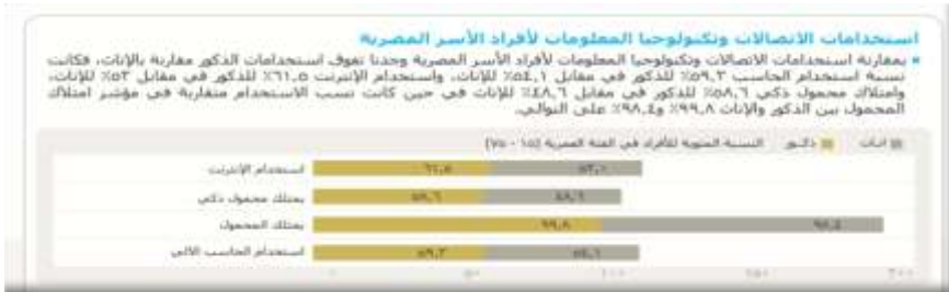
شكل رقم (٣)

كما أنه يمكن القول بأن ما يدعم زيادة تفاعل الجمهور مع الصحف الرقمية ما ورد من إحصائيات تؤكد علي تفاعل زيادة استخدام أفراد الأسرة للإنترنت، فضلًا عن ارتفاع معدلات استخدام الهاتف الذكي، وهو ما يجعل القارئ على تواصل دائم مع ما تقدمه شبكة الإنترنت من خدمات من بينها الخدمات الإخبارية سواء عبر الصحف الرقمية أم وسائل التواصل الاجتماعي، وهو ما يوضحه الشكل الآتي: (٢١)